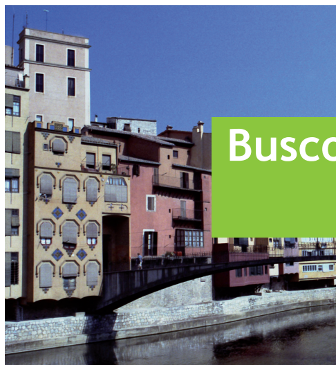
Edificios en la Costa Brava, Girona